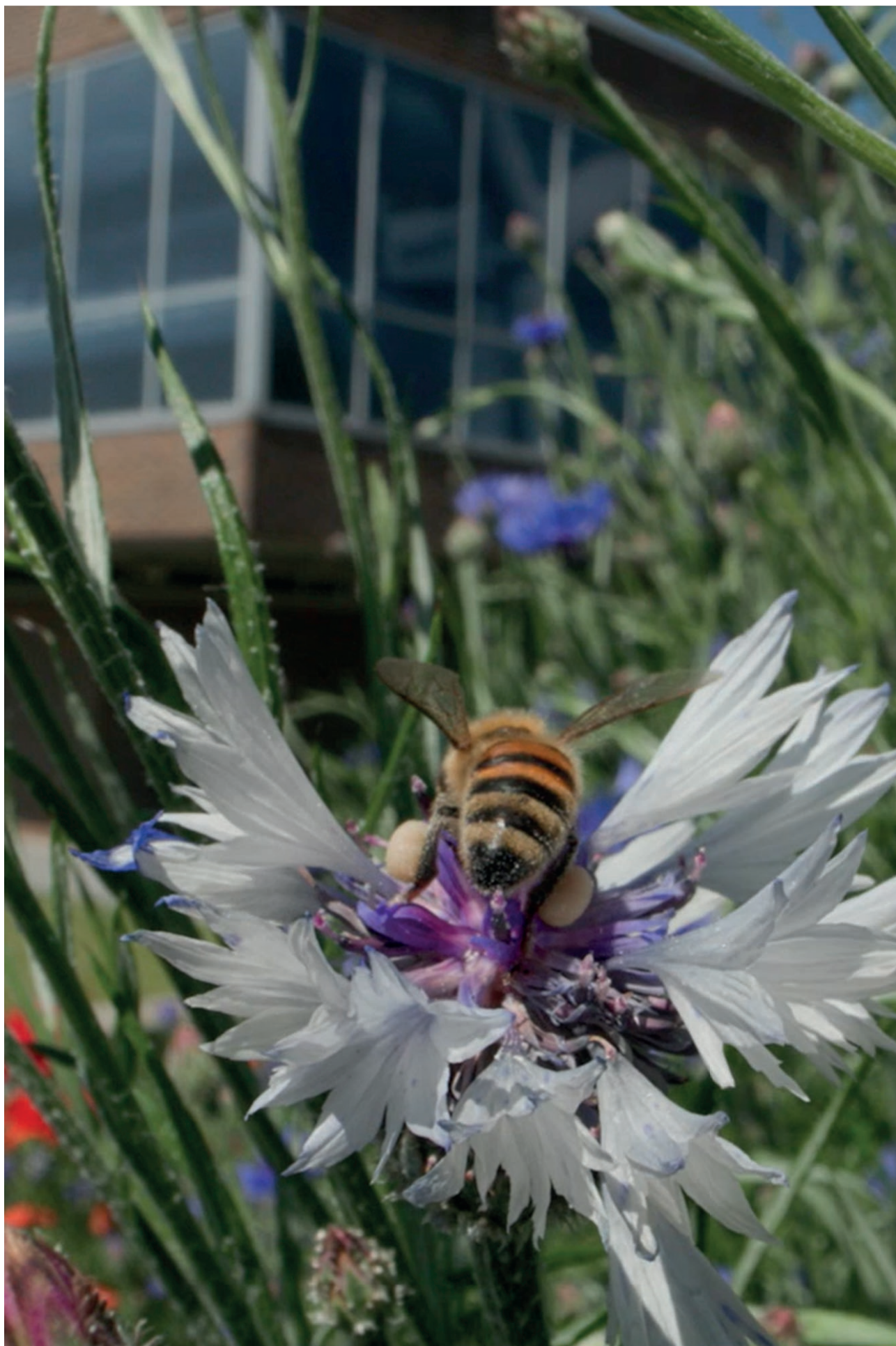
På Dusager i Aarhus er 17.200 m 2 græsplæne blevet omlagt til vildnis.