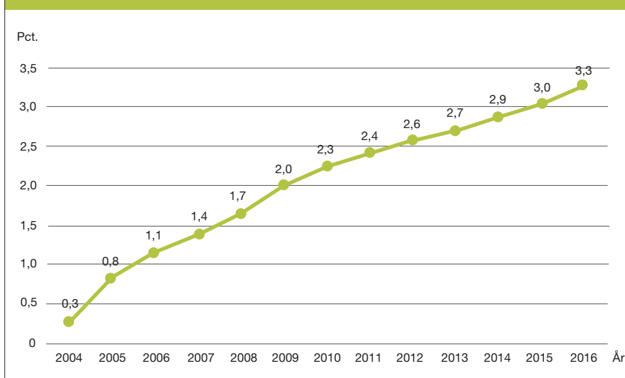
Figur 1 - Andel i pct. med opsat folkepension af de første 10 mulige folkepensionsårgange - 2004-2016

Note: Fra 2004 til 2006 blev folkepensionsalderen sænket fra 67 til 65 år. Derfor kan de beregnede andele for 2004 og 2005 ikke sammenlignes 1:1 med de resterende år, selvom beregningen er korrigeret for den ændrede pensionsalder.